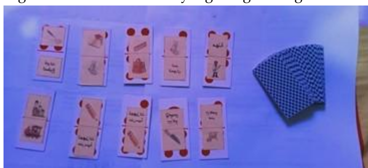
Gambar 3. Modikasi Gaple Arab

Terlihat dari gambar di atas, pengelompokan siswa yang dibagi menjadi 4, terlihat siswa yang sedang duduk berbaris kebelakang dengan perwakilan satu anak yang memegang kartu, siswa yang didepan sedang memainkan gaple Arab, sedangkan siswa yang berbaris dibelakangnya, membantunya untuk memberikan jawaban atas pertanyaan kartu yang sedang dia mainkan hal ini menunjukkan siswa mengikuti aturan dari guru dan bertingkah laku teratur sesuai yang diinginkan guru.