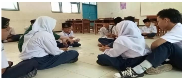
Gambar 2. Penerapan Media Gaple Arab Pada Siswa Kelas VII A

Setelah pemberian soal dan pelaksanaan pretest, peneliti mengajak siswa untuk belajar menggunakan media gaple Arab yang sudah dirancang sebelum-sebelumnya. Permainan ini dilaksanakan di kelas VII A MTs Nahdotut Talamidz Jombor Tambak Banyumas.