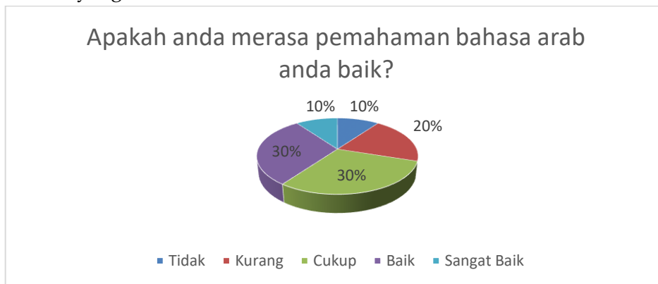
Diagram 1. hasil respond pemahaman siswa dalam belajar Bahasa Arab

Dapat dilihat dari gambar 1 di atas telah memberikan jawaban tentang etika siswa dalam kelas di saat jam pelajaran berlangsung, tidak seburuk yang dibayangkan hanya saja memang tingkah siswa yang menggemaskan, siswa akan tertarik dengan topik pembahasan diluar materi, terlihat dari gambar di atas tampak siswa yang sedang memperhatikan guru yang sedang memberikan materi pembelajaran, walaupun salah satu dari mereka tampak malas dalam pelajaran mereka tetap mendengarkan guru yang berbicara, ada yang meletakkan kaki diatas kursi.