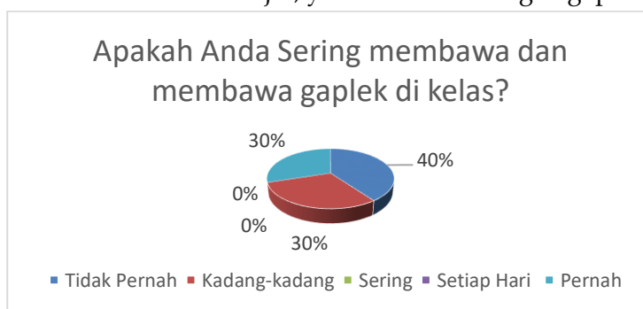
Diagram 2: Pernyataan Siswa Yang Suka Membawa Gaple Di Kelas

Kelayakan nilai siswa sangatlah kurang dan belum sesuai harapan, terlihat hanya beberapa anak saja yang bisa mendapatkan nilai diatas nilai 60. Di sisi lain penyebab dari penurunan nilai siswa bukan pada pemahaman siswa saja tetapi, siswa juga kerap bermain disaat mereka bosan dalam belajar, yaitu bermain dengan gaple atau domino.