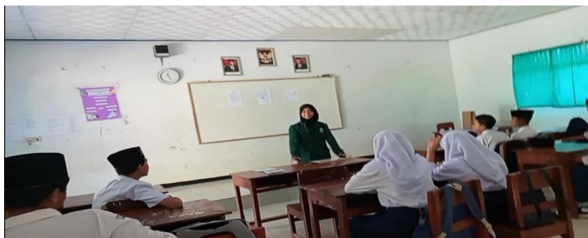
Gambar 1. Pembelajaran kelas VII A MTs Nahdotut Talamidz Jombor

Dalam pelaksanaan penelitian pada siswa kelas VII A MTs Nahdotut Talamidz Jombor Tambak Banyumas, memberikan penggambaran yang sangat baik, tidak terpikirkan siswa yang dikatakan bahwa suka bermain gaple disaat jam pelajaran.