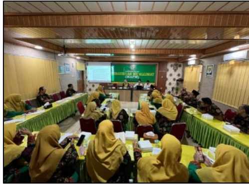
Gambar 3.5. Tampak Meeting Room Madrasah

Dokumentasi penelitian menampilkan ruang meeting madrasah yang dimanfaatkan sebagai pusat kegiatan akademik dan koordinasi kelembagaan, tempat berlangsungnya rapat, musyawarah, serta perumusan kebijakan pendidikan. Selain itu, dokumentasi juga memperlihatkan kegiatan sosialisasi teknis penggunaan aplikasi digital yang dilakukan oleh pihak madrasah kepada guru dan tenaga kependidikan sebagai upaya mendukung layanan pendidikan yang lebih efektif, transparan, dan responsif terhadap perkembangan teknologi.