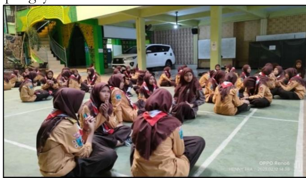
Gambar 3.2. Kegiatan Mufrodat Bersama Ma'had Aly

Berdasarkan observasi, pembelajaran keagamaan tidak hanya berfokus pada penguasaan teks, tetapi juga pada penguatan pemahaman konsep keislaman secara kontekstual melalui kegiatan pendukung seperti pengayaan mufradat dan diskusi keilmuan.