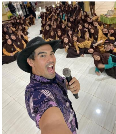
Gambar 3.1. Proses pembelajaran Bahasa asing oleh tutor yang berasal dari Delta

“Kelas bilingual memiliki tambahan pelajaran di luar KBM, yaitu hari Selasa dan Sabtu mulai pukul 13.30 sampai 14.30, dan dalam kegiatan tertentu bisa sampai pukul 15.00, misalnya untuk speaking test. Pembelajaran difokuskan pada bahasa Inggris yang diajarkan oleh tutor dari lembaga Delta di Kampung Inggris Pare.”