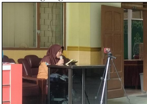
Gambar 3.3. Kegiatan Mudarosah Sebelum KBM

Berdasarkan observasi lapangan, kegiatan mudarosah berfungsi sebagai inovasi pembelajaran berbasis pembiasaan yang memperkuat kompetensi keagamaan sekaligus membangun iklim belajar Qur'ani di lingkungan madrasah.